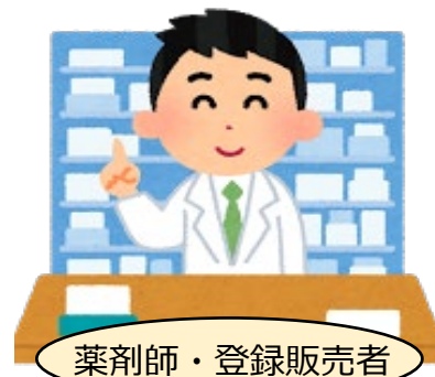
薬剤師・登録販売者

インターネットを使つての医薬品購入は手軽で便利ですが、直接、薬局やドラッグストアで医薬品を購入の方があなたに合った医薬品を購入できるのです！なぜなら、 薬剤師や登録販売者 は購入しようとする人の 表情やししゃべり方、雰囲気、歩き方 などを見ることで、 メールなどでは得られない情報も得る ことができるからです。また、医薬品の使い方などの説明も、メールよりスムーズに行うことができます。